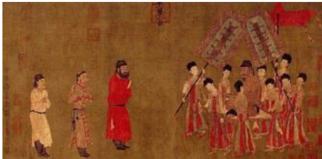
图 4 步辇图